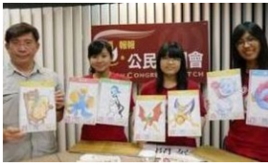
( 點此觀看影片 )