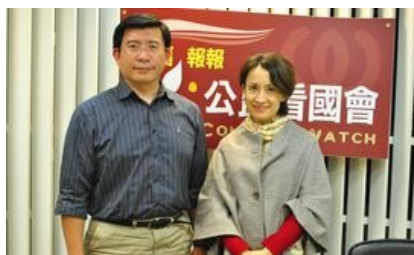
( 點此觀看影片 )