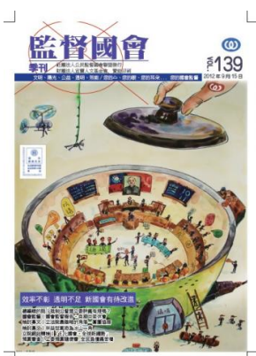
監督國會季刊第139期