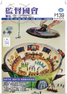
監督國會季刊第139期