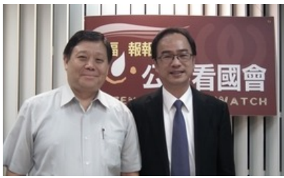
( 點此觀看影片 )