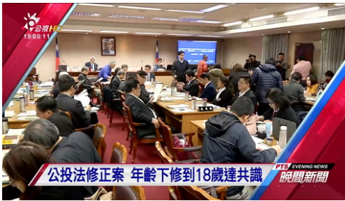
公投法修正案 年齡下修到18歲達共識 | 公視晚間新聞 12/15