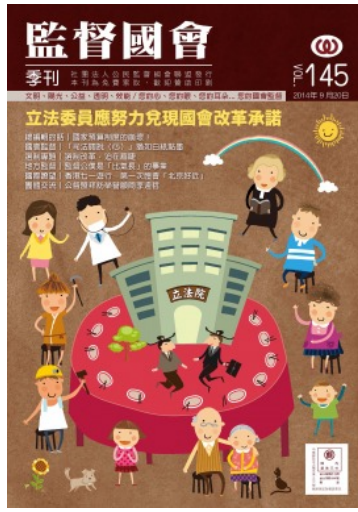
監督國會季刊第145期