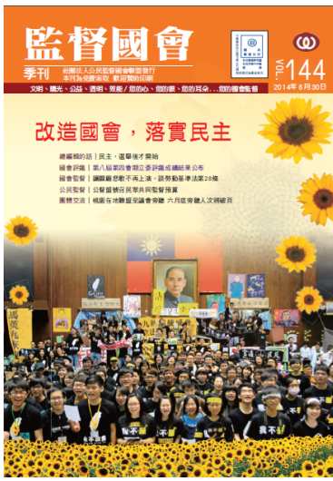
監督國會季刊第144期