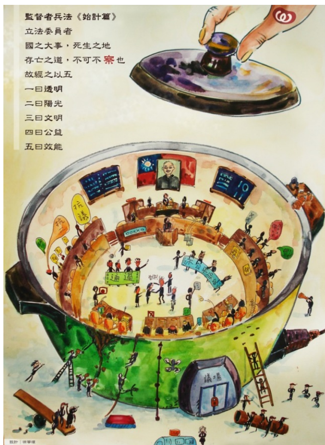
資訊的公開透明是人們

對於政府這個龐大機構的信賴基礎以及鮮少的要求之一然而，儘管這項要求如此地卑微，在號稱是民主社會的台灣仍不容易實現。