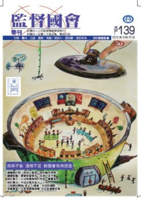
監督國會季刊第139期